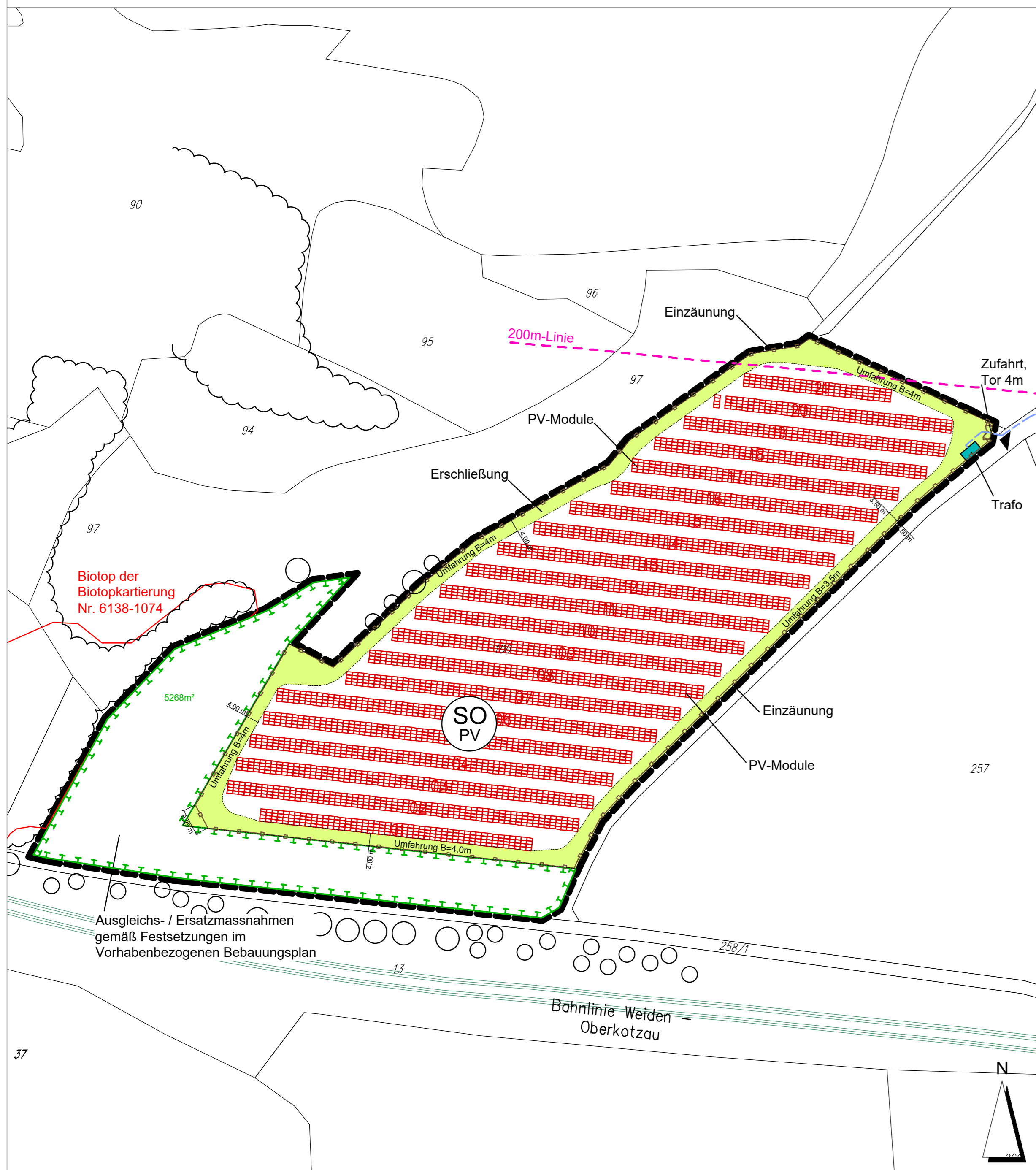
Vorhaben- und Erschließungsplan M 1:1000