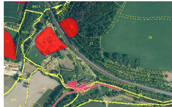
Abbildungen: links Lehen, rechts Trautenberg

In Lehen befinden sich zwei Bodendenkmäler und in Trautenberg mehrere Bau- und Bodendenkmäler mit den folgenden Bezeichnungen: