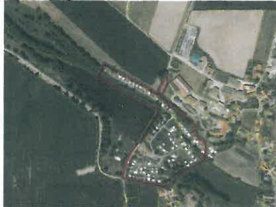
Geltungsbereich Bebauungs- und Grünordnungsplan